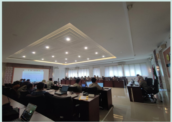
Kegiatan Koordinasi Jabatan Fungsional Pranata Komputer lingkup Badan Perakitan dan Modernisasi Pertanian (BRMP)

Melalui kegiatan ini, BRMP menunjukkan komitmennya untuk terus bergerak menuju ekosistem digital pertanian yang lebih terintegrasi. Bukan sekadar membangun aplikasi, tetapi membangun sistem yang saling terhubung, saling mendukung, dan memberikan nilai nyata bagi pembangunan pertanian Indonesia.