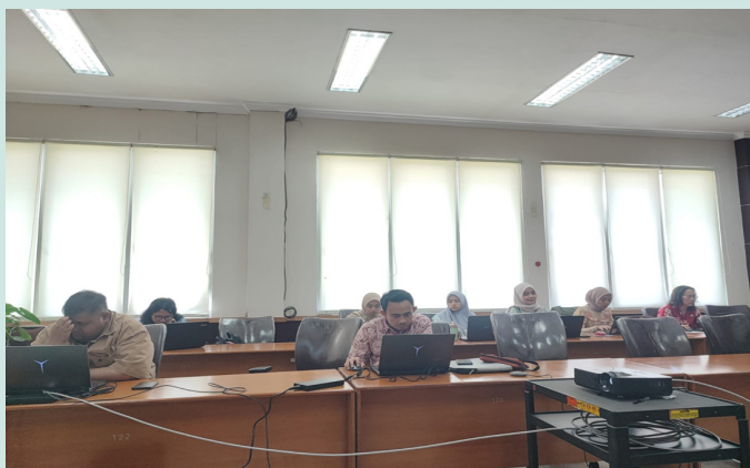
Koordinasi Identifikasi Aplikasi Lingkup Ditjen Perkebunan

Transformasi digital pertanian pun tidak lagi berhenti pada tataran wacana, tetapi mulai bergerak ke tahap implementasi nyatadimulai dari satu data, menuju satu arah yang sama