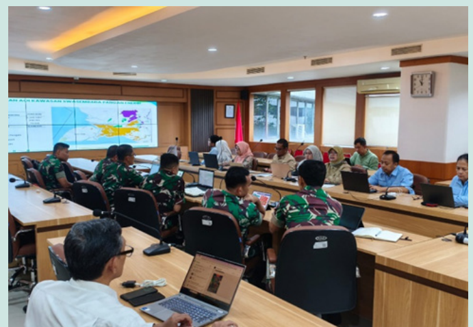
Diskusi Kolaborasi Pusdatin Kementan dan TNI AD dalam Mendukung Pembangunan Papua

Rapat yang dilaksanakan di Pusdatin Kementan ini menjadi momentum penting dalam memperkuat sinergi antar lembaga. Tim dari Mabes TNI AD melakukan kunjungan langsung untuk menggali informasi secara komprehensif, sekaligus berdiskusi mengenai mekanisme pemanfaatan data yang lebih efektif dan tepat sasaran.